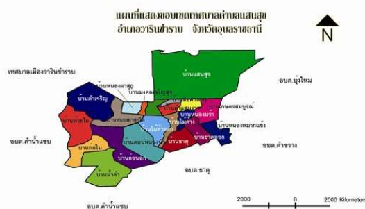
ภาพที่ 2.1 แผนที่แสดงขอบเขตเทศบาลตำบลแสนสุข